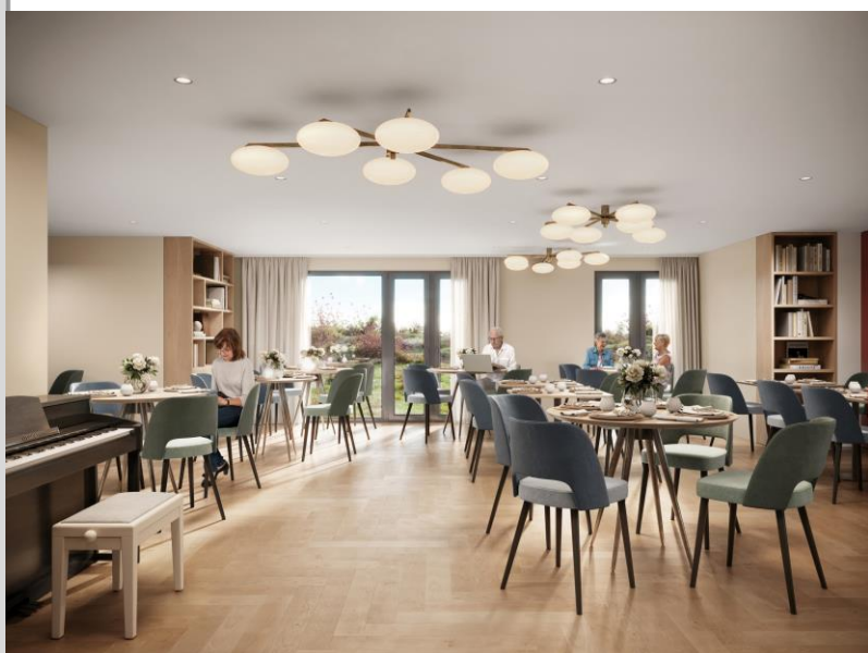
Salle de restaurant